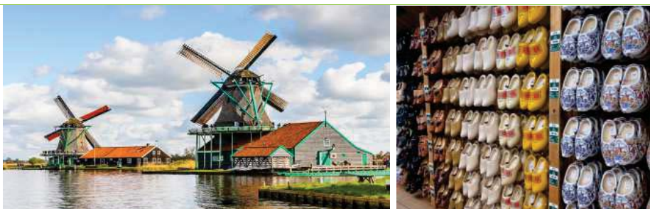
【風車村 Zaanse Schans】是荷蘭保存最完整的「戶外博物館」。