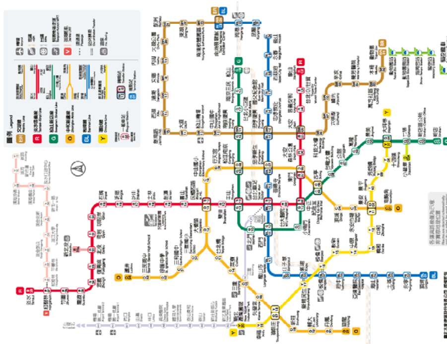
臺北捷運路線圖 (站名：忠孝新生站3號出口)