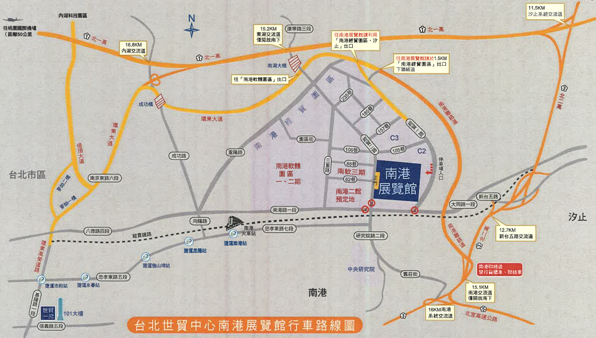
台北世貿中心南港展覽館行車路線圖

往南港展覽館行車路線說明：(南港展覽館衛星導航座標：X(經度):121° 34' 58.9"、Y(緯度):25° 47.6")