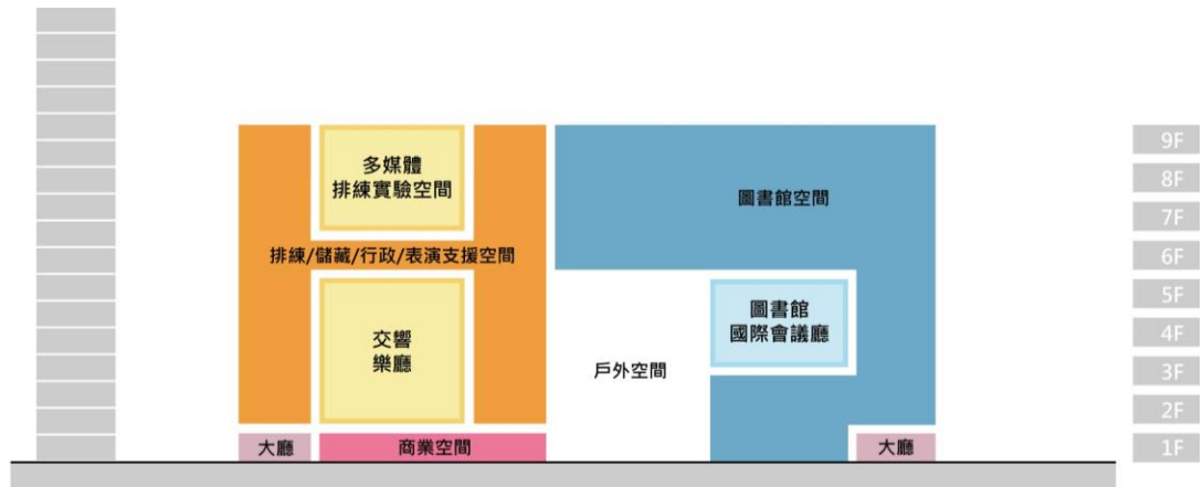
主要機能空間分解圖