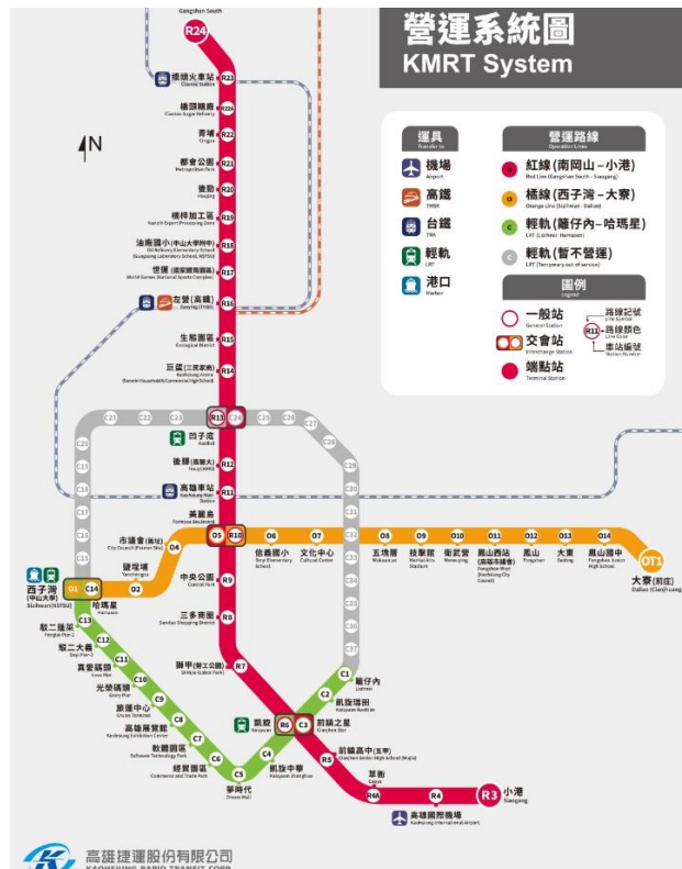
高雄捷運路線圖(站名：文化中心站3號出口)