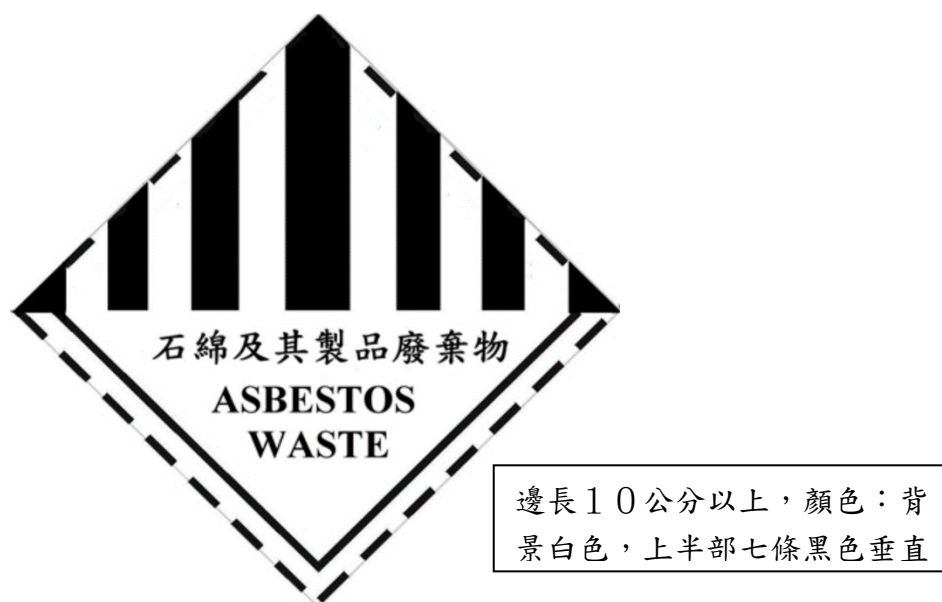
圖 2、有害事業廢棄物特性之標誌-石綿及其製品廢棄物

(三) 太空包外袋應標示事業名稱、廢棄物代碼 C-0701 (石綿及其製品廢棄物)、貯存日期、數量、成分及區別有害事業廢棄物特性標誌 (如圖 2)。