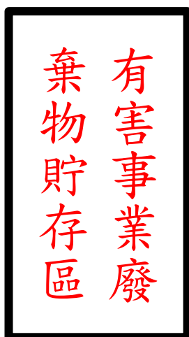
圖 3、貯存區設置白底、紅字、黑框之警告標示圖例